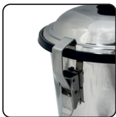
Broche de acero