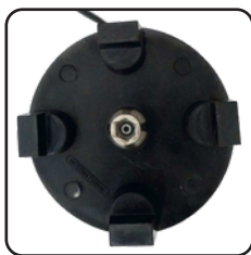
Corona de polipropileno de alta densidad.