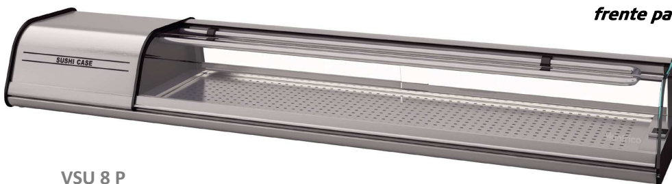
VSU 8 P