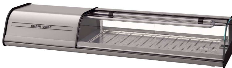
VSU 6 P