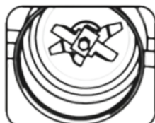
Aspas de abanico diseñadas para una molienda más densa